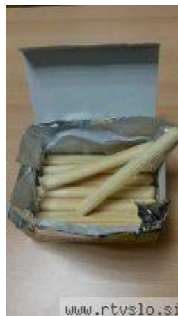
Vafelj z limonino kremo.

Transmaščobe so zdravju škodljive. Že dolgo je znano, da so eden izmed zelo pomembnih dejavnikov tveganja za razvoj srčnožilnih bolezni, zato bi jih morali popolnoma izključiti iz našega jedilnika.